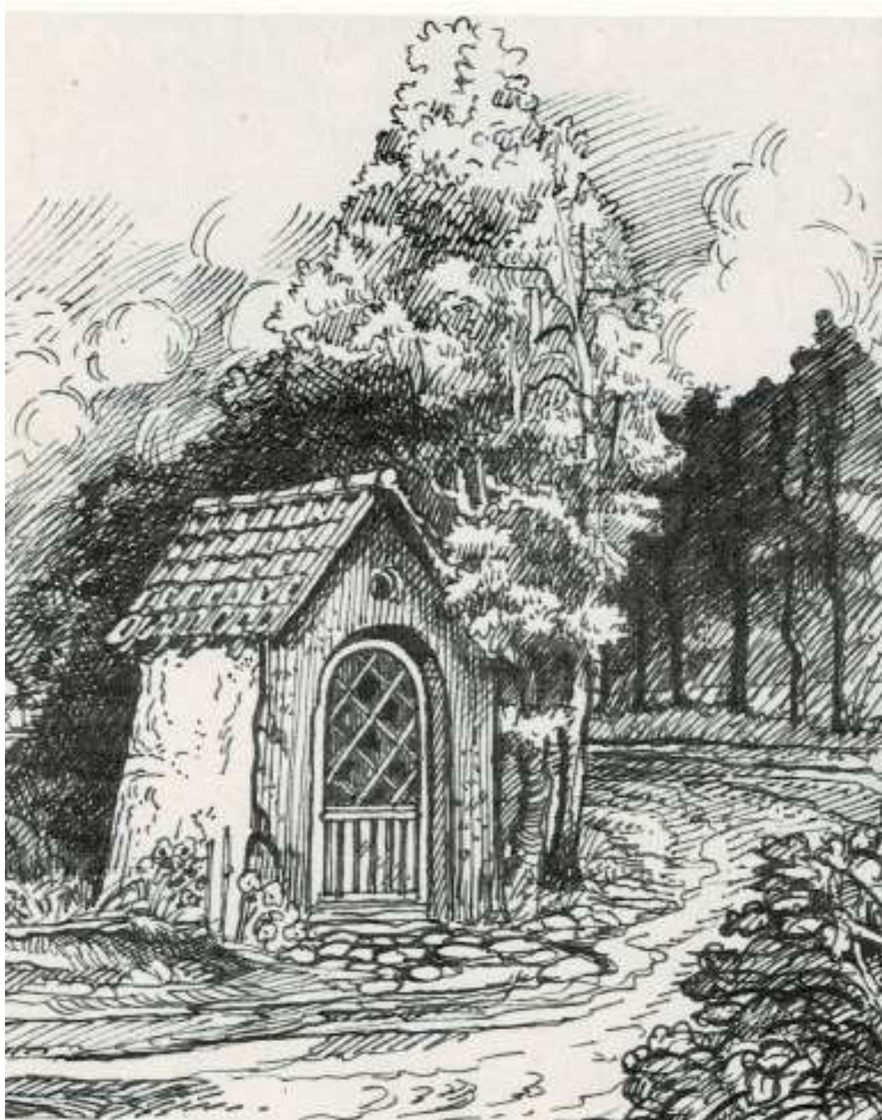
Mariakapel 1894, Kiekopstraat/Molenheidestraat Wolfsdonk

verlost worden. Daar zorgt dat Lieve Vrouwke voor, aan de rand van de hei.