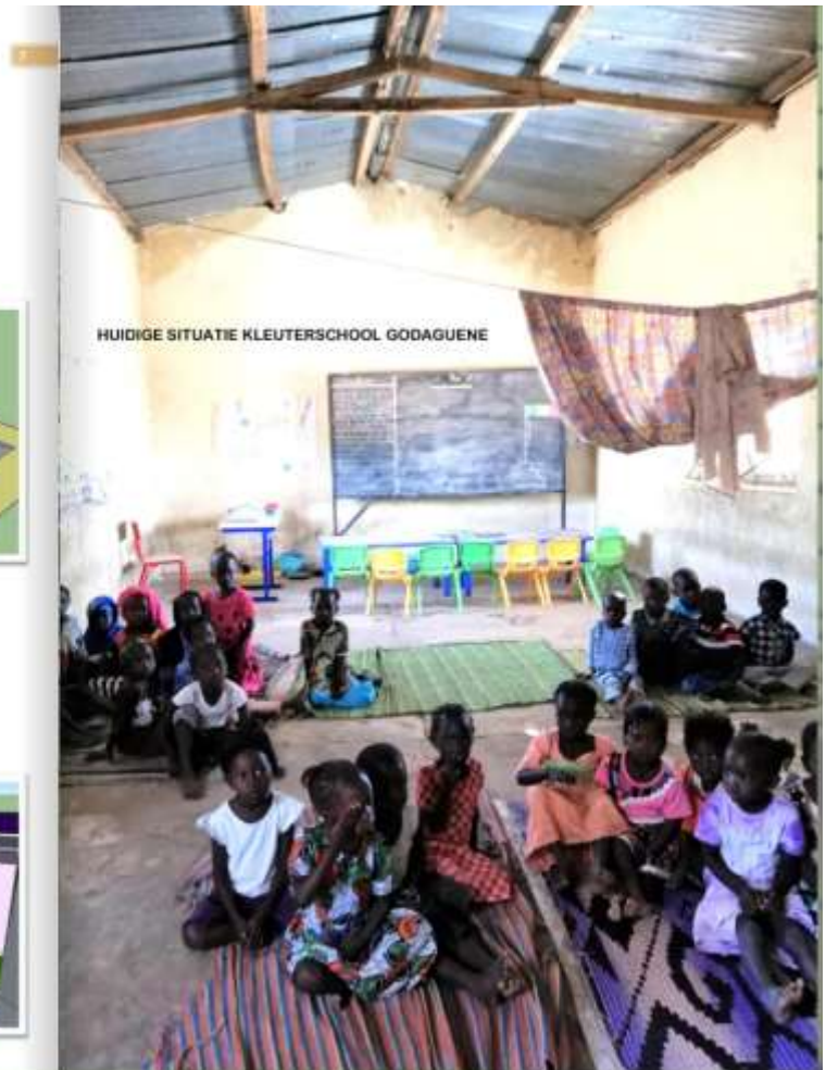
schooltje vroeger en later