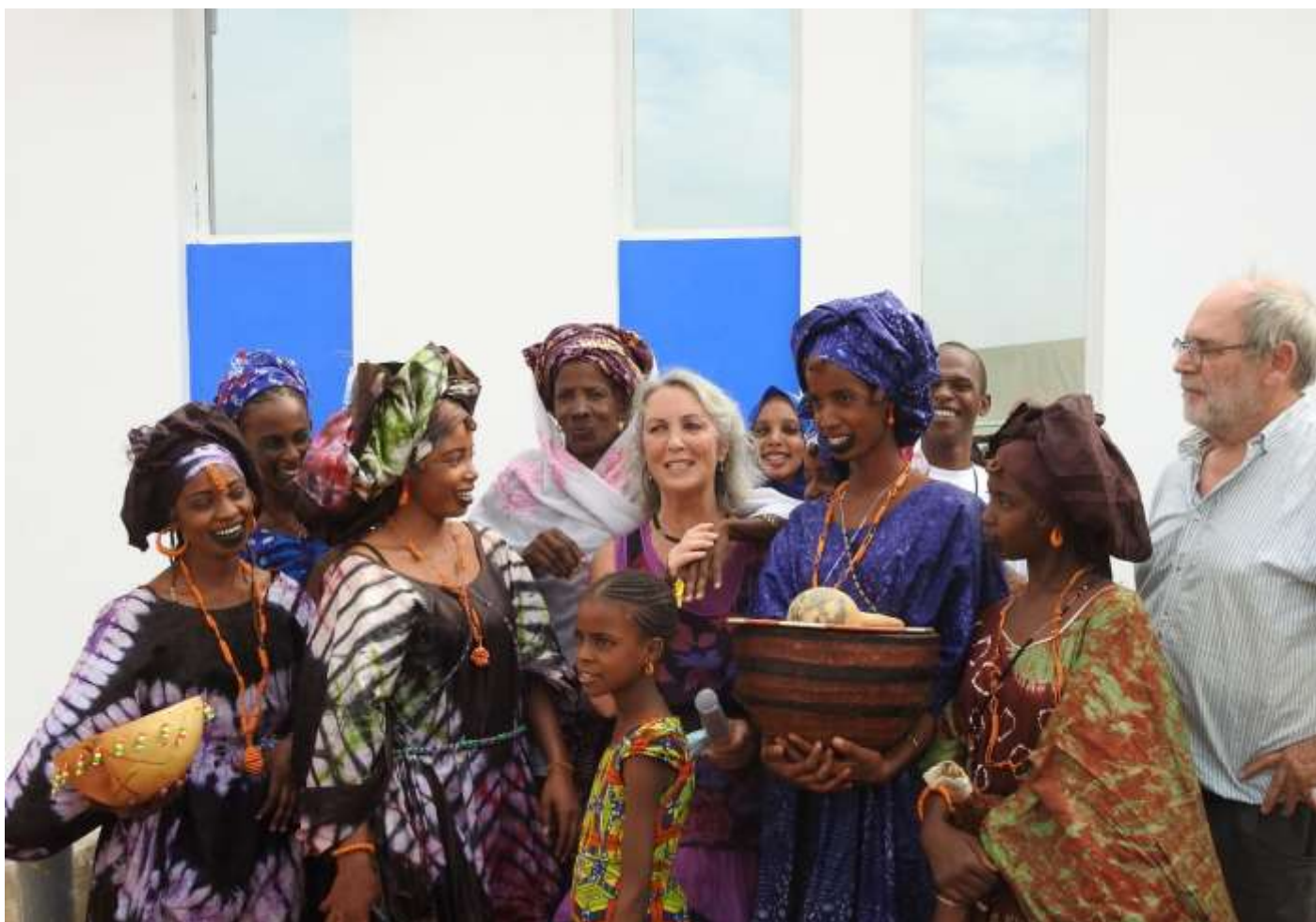
medische post in Sangué tijdens de inhuldiging