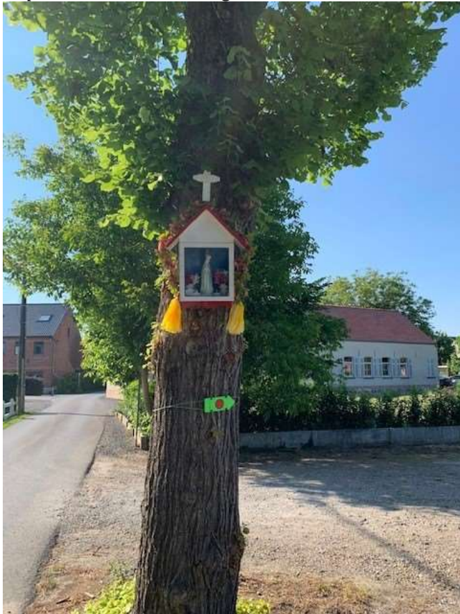
Kapelleke in de Kerkweg