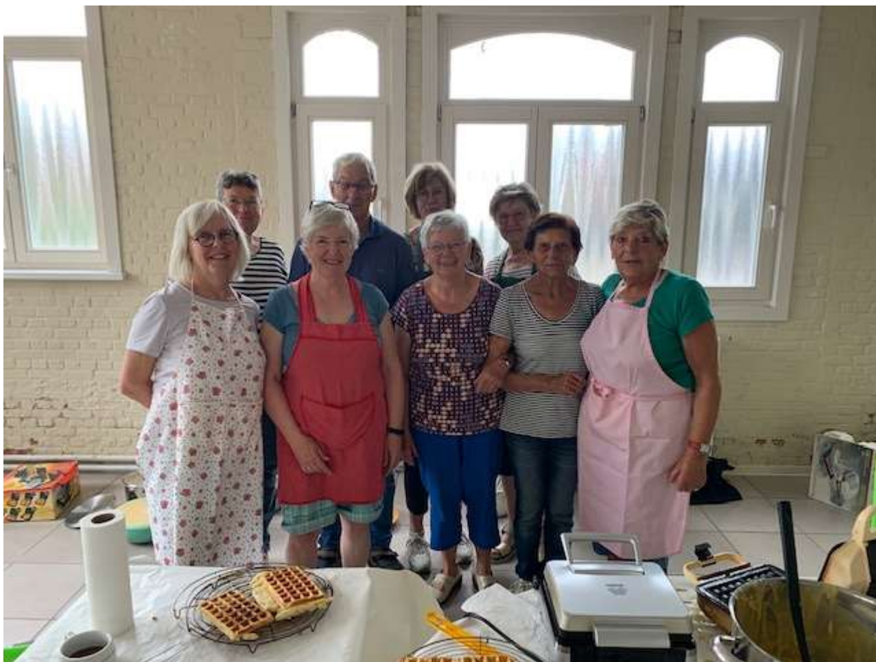
Een aantal dames van het bestuur tijdens hun "wafelenbak" voor het afgelopen Wolfsfeest !